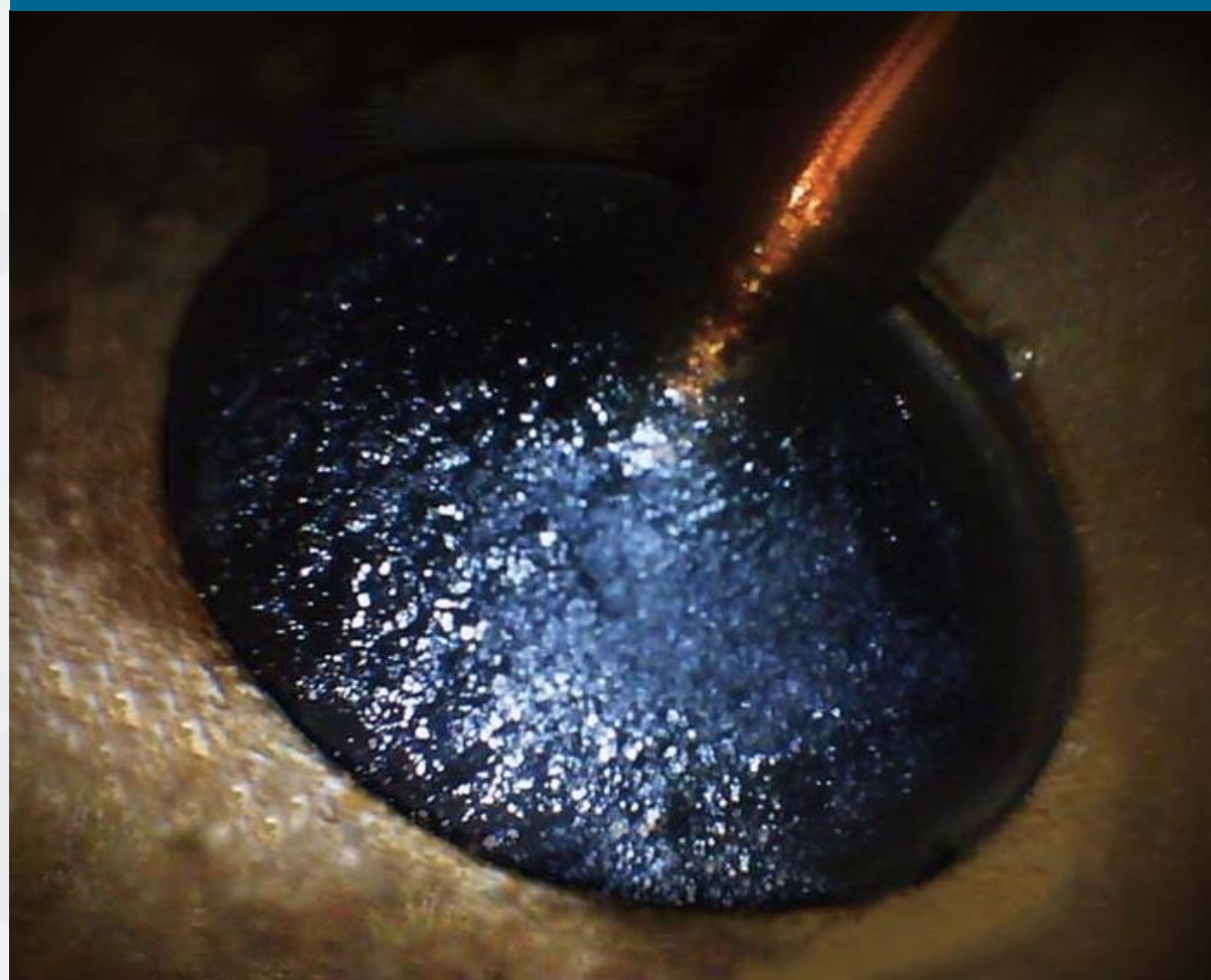
SX6000 フューエルトリートメント 添加前